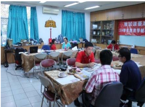
兩地教師教學經驗交流中