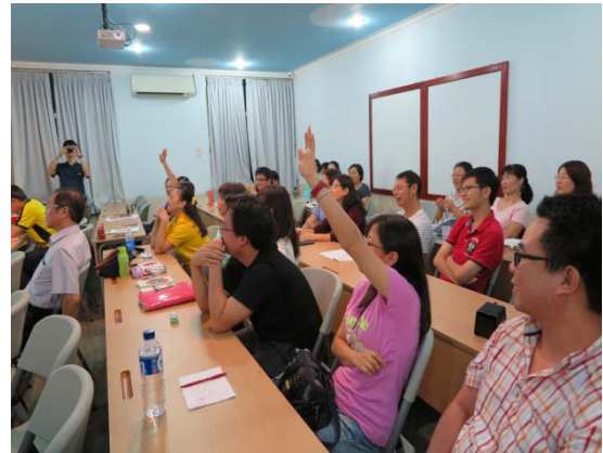
雅加達老師們專注研習中