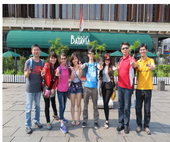
台灣參訪團與當地接待的組長合影於巴達維亞咖啡店前